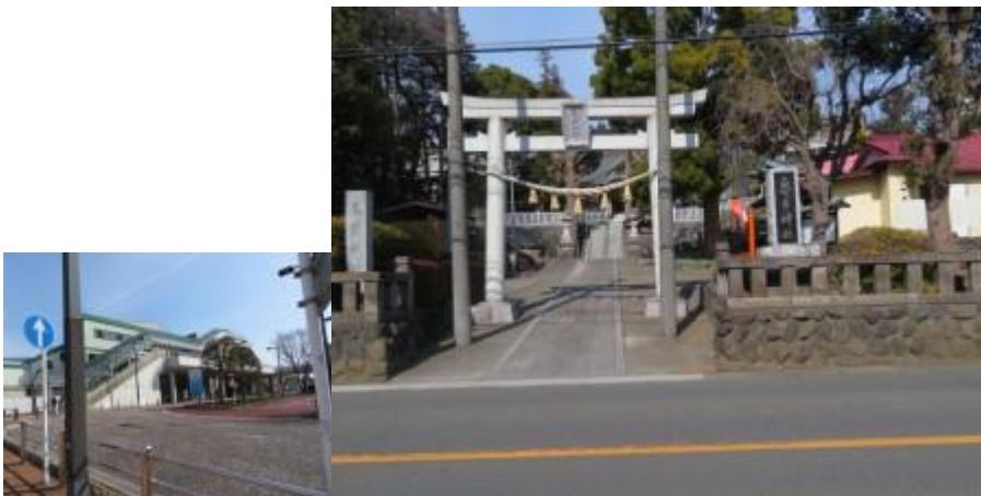
※六会日大前駅、亀井神社

⑦13時8分、亀井神社前を通過。今年の巨人軍の優勝を亀井新コーチにあやかって祈願する。大きく道路を回り込んだ先に、相鉄線や横浜地下鉄も合流する湘南台駅（13時30分）があった。10年位前の横浜地下鉄踏破の際以来の立ち寄り懐かしくなった。