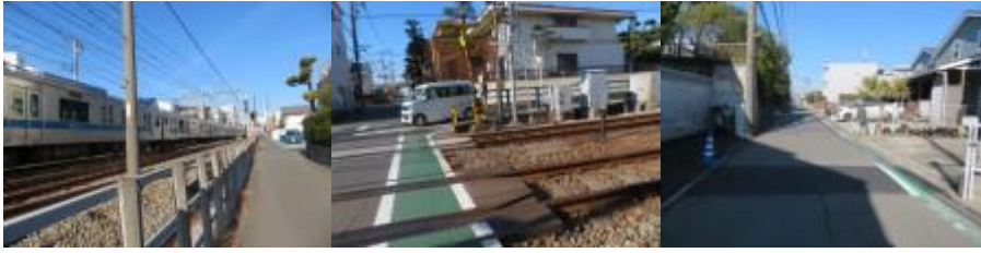
※鵜沼海岸駅への路