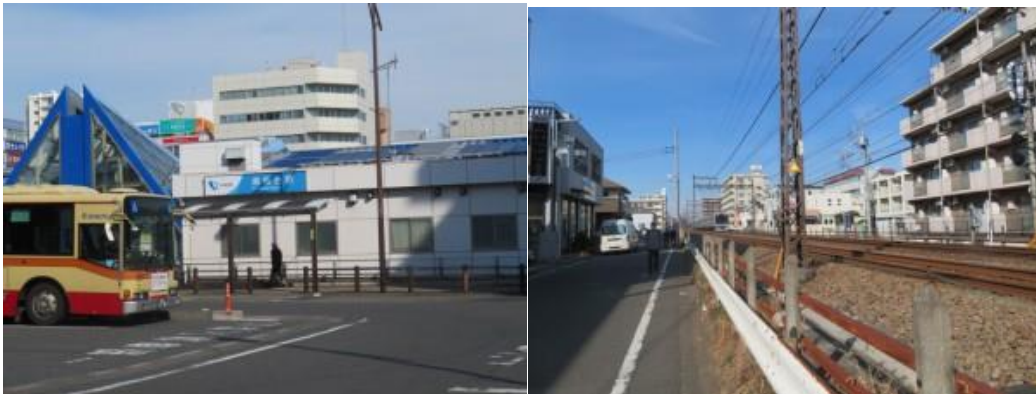
※湘南台駅、湘南台駅界限

⑧13時44分、長後5号踏切を横切り、鉄道の右側となる。その先に藤沢市立北渋谷ヶ原公園があった。ここから暫く歩いた先に長後駅（14時）があった。本日まで、長後駅の所在は横浜市とまた湘南台は大和市と勘違いして記憶していた。本日の歩きで何れも藤沢市と判明。広大な地域を持つ藤沢市には驚いた。いい勉強になった。