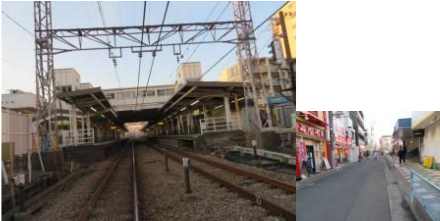
※鶴間駅、南林間駅への路

⑫懐かしい鶴間の商店街を經由して南林間駅を目指す。17時2分、30数年前家族連れでよく買い物に行ったセリア（かつて忠実屋）前を通過。その先に本日の終着駅の南林間駅（17時5分）があった。本日の歩きを通じ、街並みが途切れないう、ほぼ平坦な道筋が続く江ノ島線の魅力を痛感する。加えて、南林間駅の交通の便の良さも。更に、小田急線に住んでよかったと思う瞬間であった。