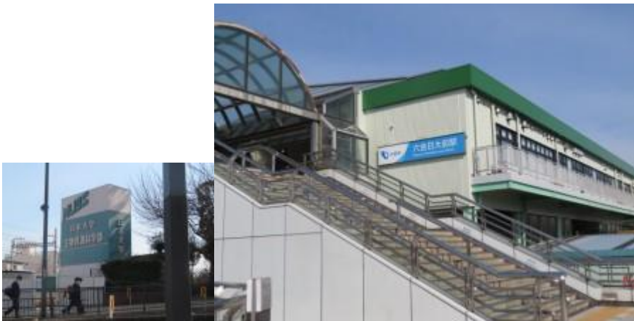
※日本大学生物資源科学部、六会日大駅前