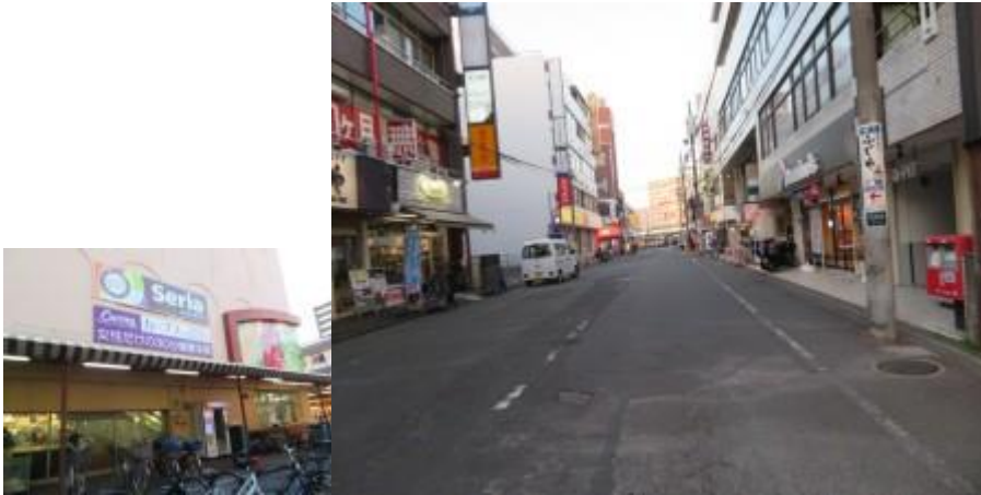
※セリア、正面に南林間駅