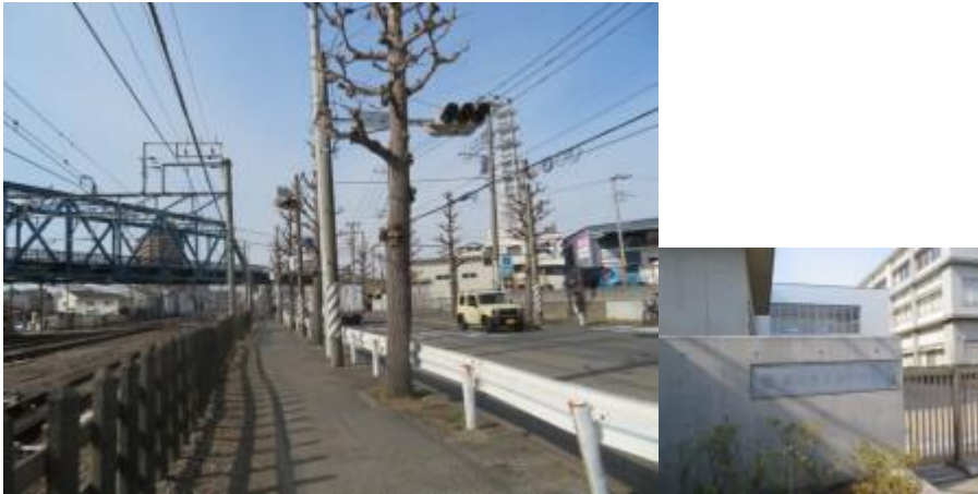
※前方に江ノ島線が JR 線を横切る、藤沢市立本町小学校