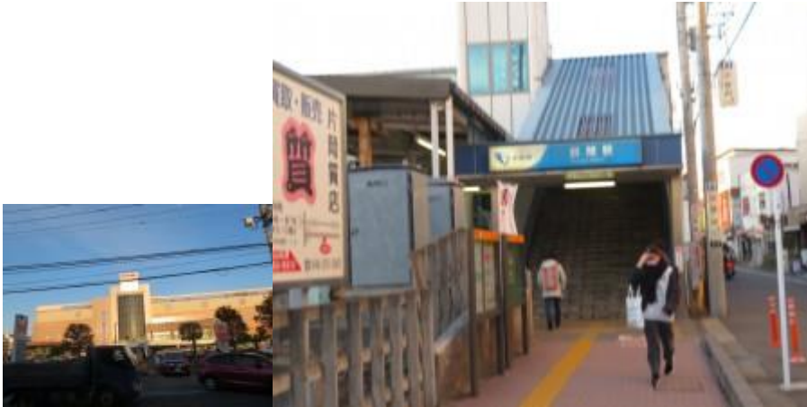
※オークシティ、鶴間駅