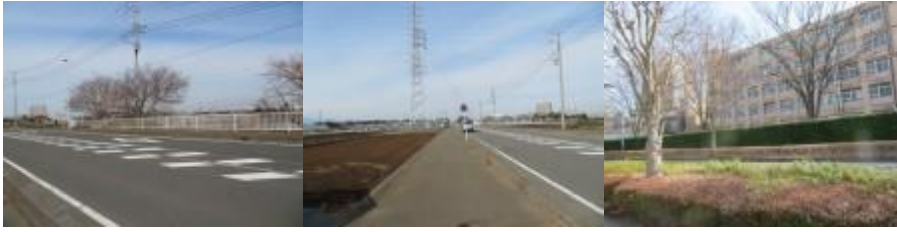
※六会日大駅への路、日本大学の校舎