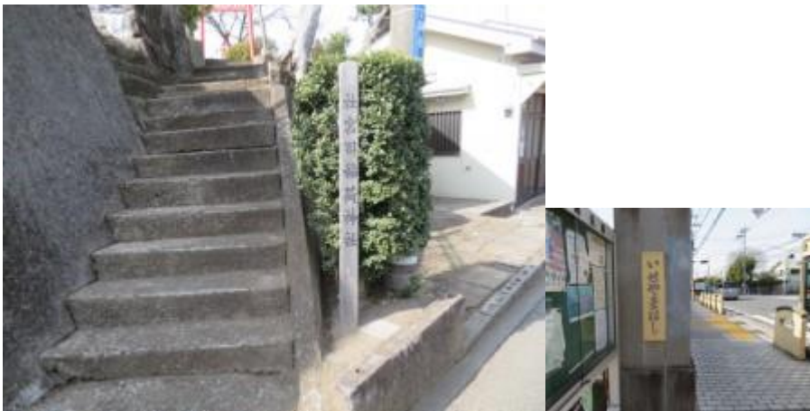
※社宮稲荷神社で安全祈願、伊勢山橋