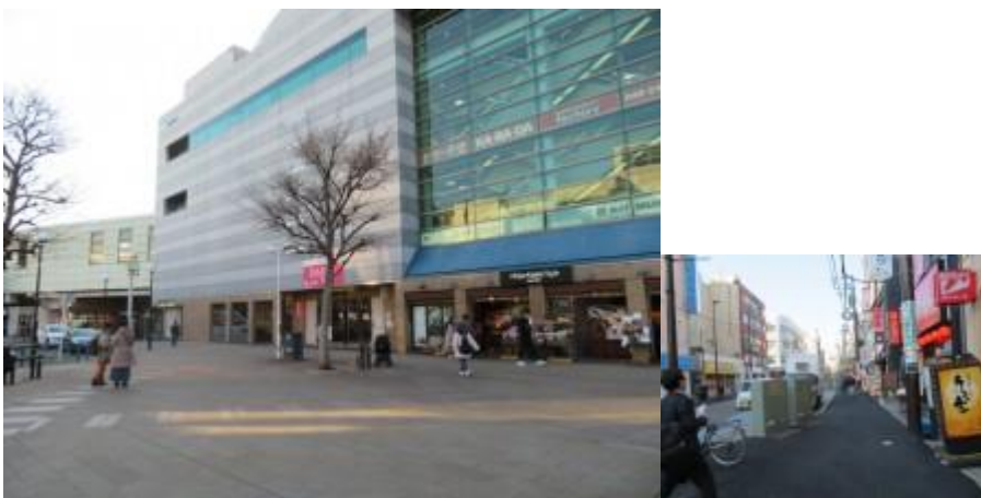
※大和駅前広場、大和商店街