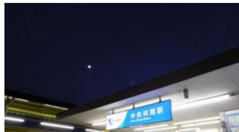
東林間駅 中央林間駅